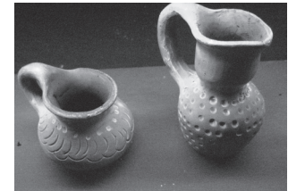
FIGURA 8. PIEZAS ARTESANALES CON PELÍCULA DE Al_2O_3:TB^{3+} ESTIMULADAS CON LUZ-UV Y EXCITADAS A 302 NM