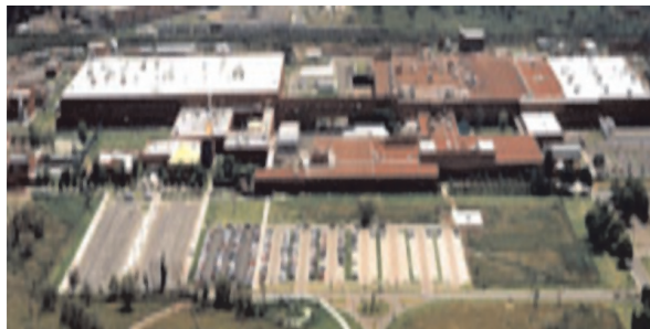
Figura 1. Planta IBM-guadalajara

propuesta de acuerdo a su materia, basándose en el objetivo a alcanzar, se planea la visita a partir del cuarto semestre en cada carrera, estas a su vez serán planteadas ante el Consejo Académico, el cual evaluará de acuerdo a la importancia de la empresa, es decir el prestigio que tiene dentro del mercado, tamaño, localización y que cumpla con las expectativas de la materia y de los alumnos. Otro aspecto importante es la relación de la empresa con la Universidad y la asistencia o participación del grupo en visitas pasadas.