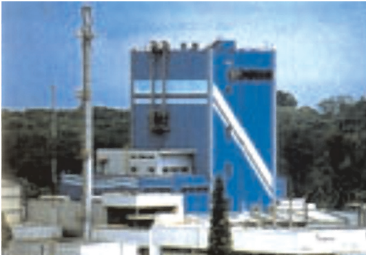
Figura 2. Nestlé, S.A de C.V. PLANTA - Coatepec

conocimientos son complementarios y forman de manera completa al individuo.