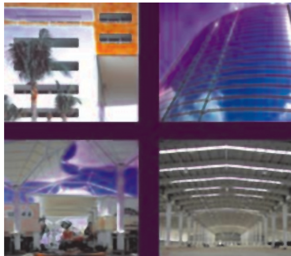
Figura 3. Centro comercial La isla-Cancún.

Esta actividad inició en 1998 considerando un periodo de 360 horas de tiempo completo para los alumnos que se encontraban en octavo semestre y en 1999 se realizan al término del sexto y octavo semestre con un periodo de 280 hrs., cada periodo. Se le proporciona un directorio de empresas posibles de acuerdo a su carrera, posteriormente pasan con la Coordinación de Estancias y Prácticas Profesionales para hacerle llegar sus propuestas (por lo menos 3 opciones, su Currículo Vitae impreso y en disco para proceder al contacto con la empresa por vía telefónica, fax o correo electrónico. Para esto es importante tener los datos completos de la empresa, el giro, descripción de las principales actividades, nombre de los jefes inmediatos, teléfono, fax, nombre de la persona encargada de estas solicitudes, en algunas empresas los denominan becarios, practicantes o residentes.