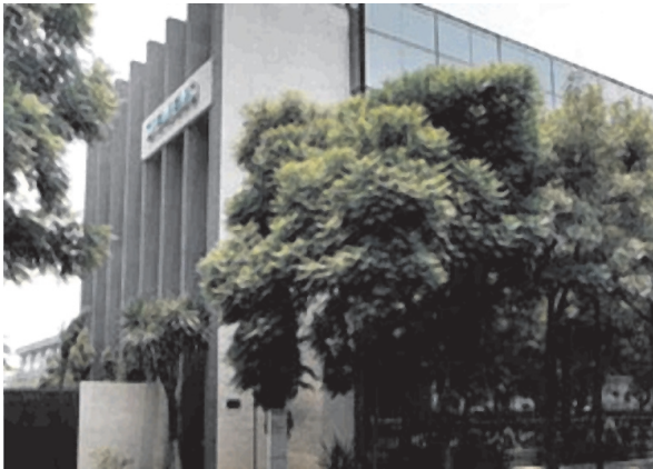
Figura 4. Siemens S.A de C.V. Planta -Querétaro

tiempo es mínimo, por lo que sugieren un periodo de por lo menos 2 meses y medio, es decir 10 semanas que equivalen a 400 horas.