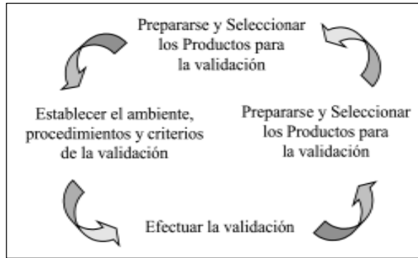
Figura 1. El papel de la validación en el CMMI.

Las prácticas específicas que resumen la estandarización del proceso se muestran en la Tabla 1. Cabe mencionar que en este artículo se omiten los detalles de las prácticas genéricas del proceso, puesto que la institucionalización de un proceso de mejora (a través de los niveles de capacidad o madurez del CMMI) se da a través de un proceso ya estandarizado por las prácticas específicas de esta Tabla.