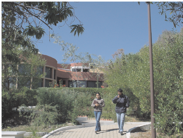
Instalaciones del Centro de Idiomas

Hoy en día, ningún método tiene una aceptación total entre el mundo de la enseñanza de idiomas, sino que se promueve una metodología ecléctica que pretende seleccionar aspectos de todos los métodos de acuerdo a las circunstancias en donde se da la enseñanza. También se pone énfasis en diferentes estilos