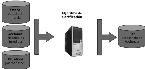
ILUSTRACIÓN 2. ESQUEMA DE LOS ELEMENTOS DE LA PLANIFICACIÓN.

Los elementos que integran la disciplina de planificación y scheduling inteligentes (P&S), aunque son la base de nuestra propuesta, pasan totalmente inadvertidos para los usuarios, ya que ofrecen sus servicios de manera transparente a través de las herramientas de e-learning descritas anteriormente; herramientas que utilizan servicios Web o procesos internos para comunicarse con las de P&S.