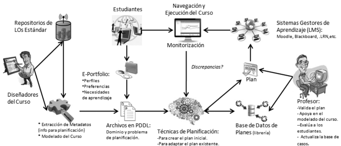
ILUSTRACIÓN 1. ARQUITECTURA GENERAL DE LA PROPUESTA